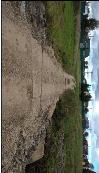
Рис.3 Проезжая часть над трубой.