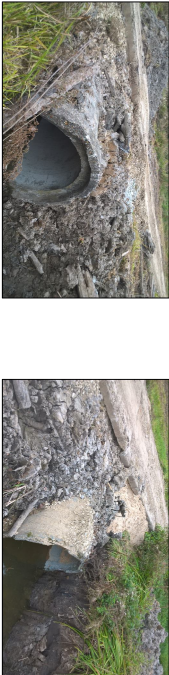
Рис.1 Вид водопропускной трубы слева.